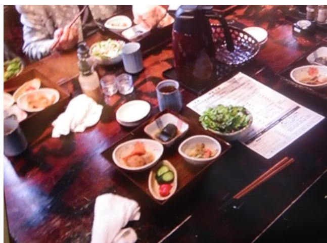
↑お食事もおおいしそうです♪